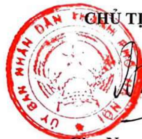
Chu Ngọc Anh